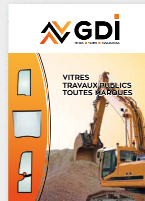
Vitres travaux publics