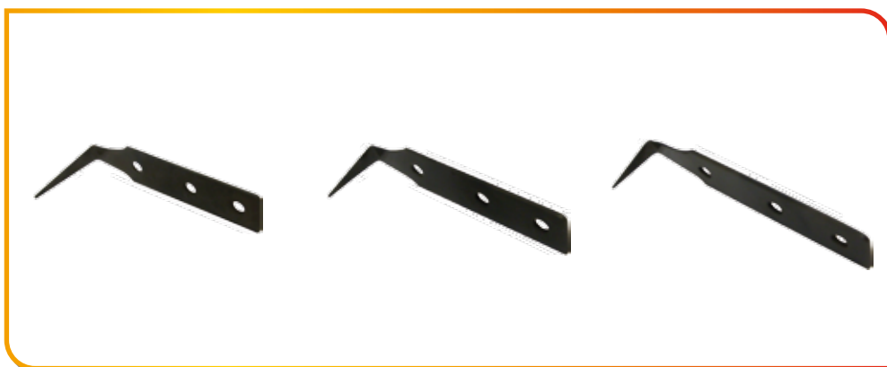
Lame de coupe à froid 19 mm