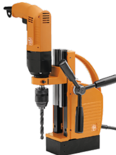
Support électromagnétique pour perceuse FEIN (livré sans perceuse)