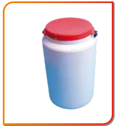
Savon microbilles sans solvant 3 kg