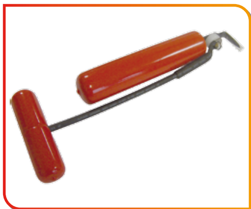
Couteau manuel à froid