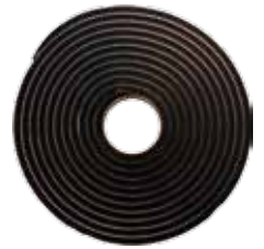
Butyle à froid pour étanchéité Ø 8 mm L 4,5 m