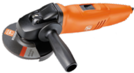
Meuleuse d'angle compacte FEIN système quick in 1200 W Ø 125