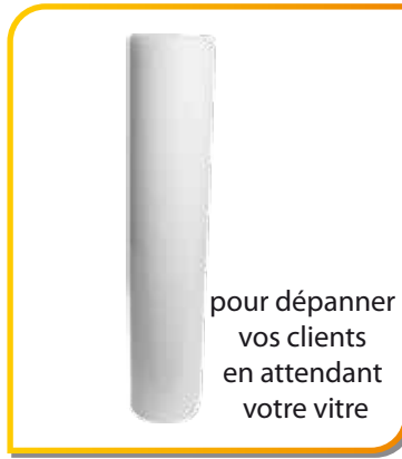
pour dépanner vos clients en attendant votre vitre