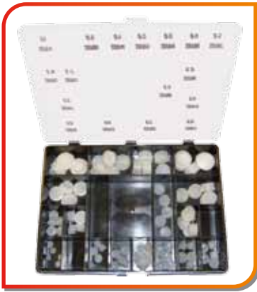
Coffret de 85 bouchons plastiques (17 références de Ø différents)