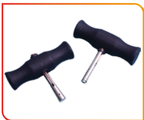
Poignées pour corde à piano (livrées par 2)