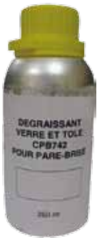
Dégraissant activateur primaire 250 ml