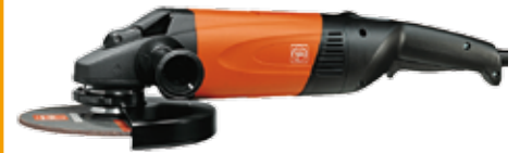
Meuleuse d'angle FEIN système quick in 2000 W Ø 230