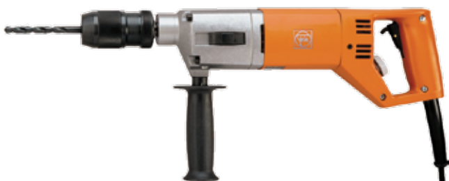
Perceuse à deux vitesses FEIN 740 W mandrin 16 mm