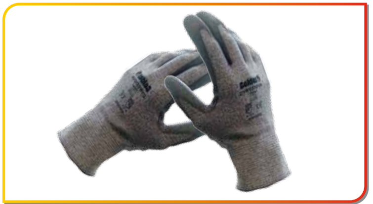
Gants pour la manipulation des vitres, anti-coupures et anti-dérapants