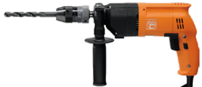
Perceuse à deux vitesses FEIN 450 W mandrin 13 mm