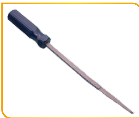
Aiguille amorce longue renforcée