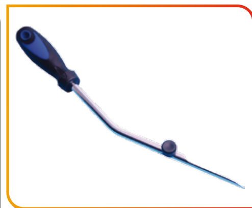
Outil long pour corde à piano