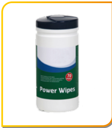
50 lingettes imprégnées sans solvant pour résine, huile, cambouis, etc