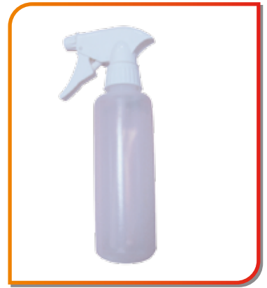
Pulvérisateur 500 ml