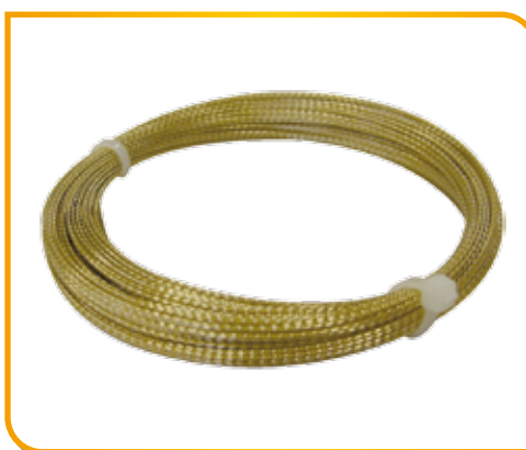
Corde à piano tressée L 21 m