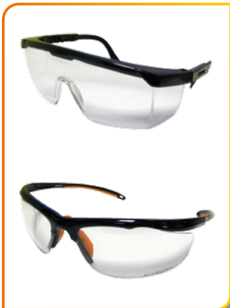
Lunettes gamme design 22 gr