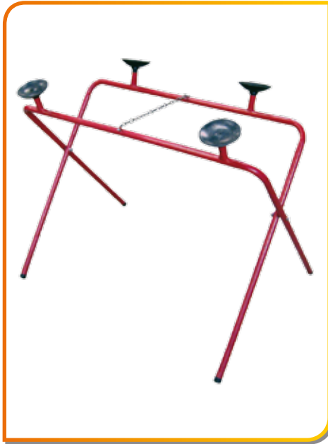
Table à pare-brise réglable en hauteur revêtement mousse