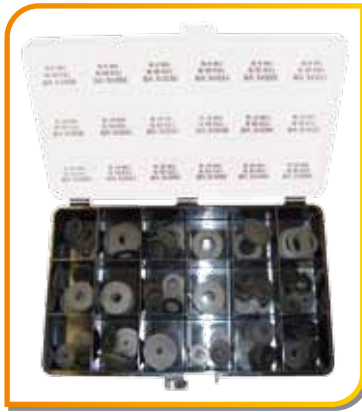
Coffret de 180 rondelles caoutchouc (18 références de Ø différents)