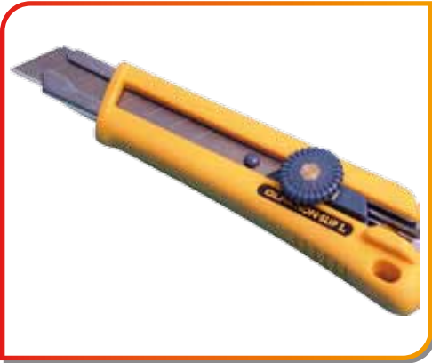
Cutter Olfa lame de 18 mm Réf. AP11032