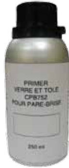
Primaire noir 250 ml