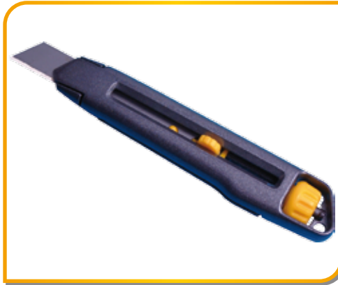
Cutter Stanley lame de 18 mm Réf. AP11034