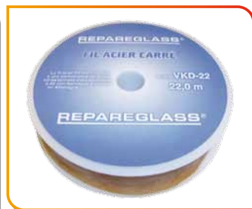
Corde à piano carrée L 22 m