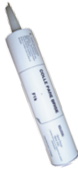
Cartouche polyuréthane 310 ml