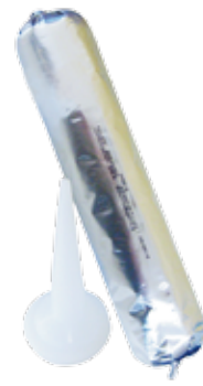
Berlingot Polyuréthane 400 ml