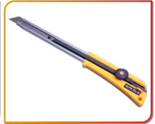
Grand cutter Olfa lame de 18 mm Réf. AP11035