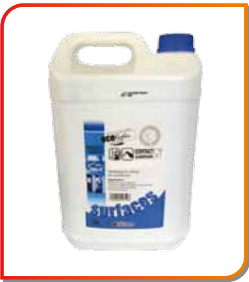
Nettoyant vitres 5 l