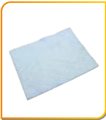
50 carrés d'essuyage résistants et absorbants