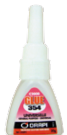
Colle rapide 20 gr