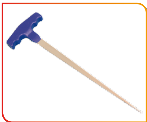
Aiguille amorce longue en forme de T