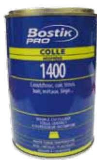
Colle néoprène 1000 ml