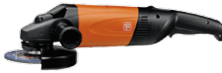
Meuleuse d'angle FEIN système quick in 2000 W Ø 180